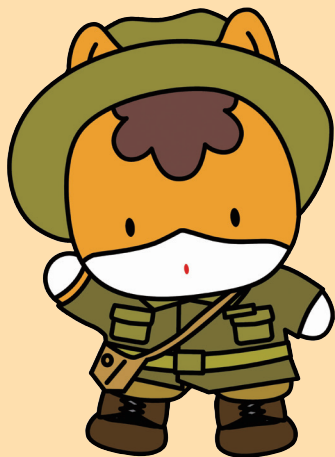
群馬県のマスコット「ぐんまちゃん」